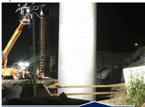
Eliminación de formularios de columna